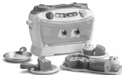
Number Lovin' Oven 2+ years

Recycle. Find out how to recycle this product at leapfrog.com/recycle or call (800) 701-5327. For UK consumers, visit www.leapfrog.co.uk/recycle and /support .