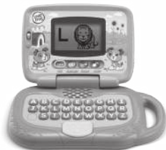
My Own Leaptop™ 2+ years