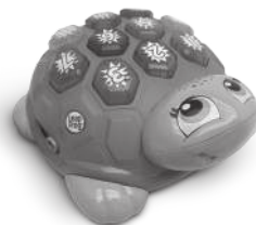
Melody the Musical Turtle™ 2+ years